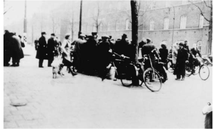
25 februari 1941 Februari-staking. Stakende trambestuurders in de Amsterdamse Sarphatistraat.