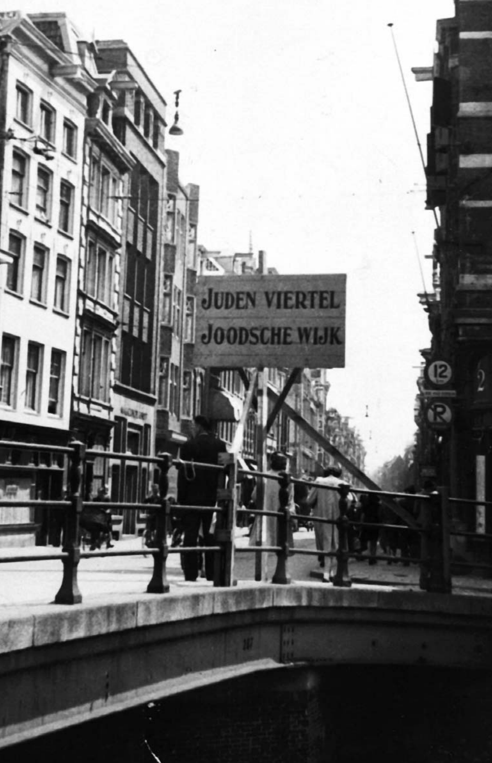
De Jodenbreestraat, een van de toegangen tot de joodse wijk.