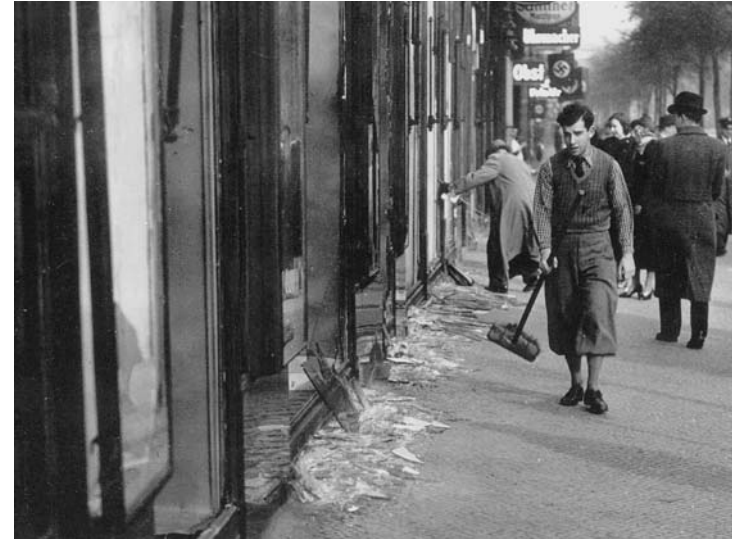
1938 De Reichskristallnacht . Joodse winkels na de Kristallnacht in Frankfurt.

Ook in nazi-Duitsland kwamen pogroms voor. Bijvoorbeeld de Reichskristallnacht van 9 op 10 november 1938. In Parijs had een joodse jongen, Herschel Grünspar, een aanslag gepleegd op de tweede secretaris van de Duitse ambassade. Hij deed dat uit protest tegen de onderdrukking van de joden in Duitsland. De ambassademede-werker kwam daarbij om het leven. In Duitsland barstte vervolgens een zogenaamd spontane volkswede uit. Talloze ruiten van joodse