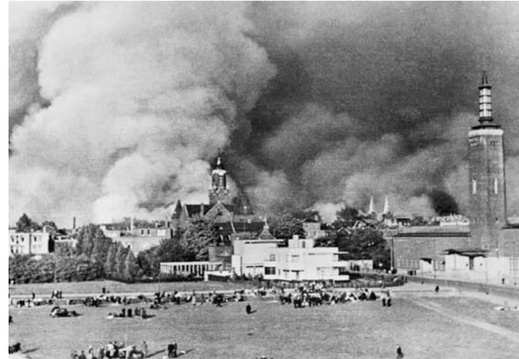
14 mei 1940, bombardement op Rotterdam.

Wie Mein Kampf had gelezen of had geluisterd naar de redevoeringen van Hitler, of in Duitsland bij joodse winkels het opschrift ' Deutsche wehrt euch, kauft nicht bei Juden ' had gelezen, wist bij wie Hitler de schuld van alle problemen legde. Daarnaast vormden de communisten de politieke tegenpool, en dus tegenstander op leven en dood, van de nationaal-socialisten van Hitler. Op de één of andere, zeer warrige, wijze wist Hitler in Mein Kampf joden en communisten met elkaar in verband te brengen. Als Hitler het over het Weltjudentum had, sprak hij meteen ook over het marxisme. Het feit dat Hitler op 23 augustus 1939 zijn minister van Buitenlandse Zaken Von Ribbentrop een niet-aanvalsverdrag liet tekenen met zijn Rus-