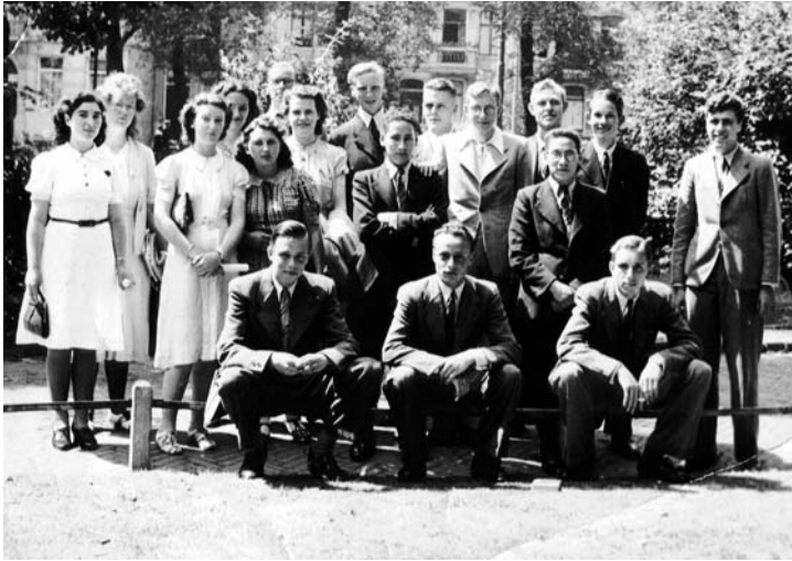
Eindexamenkandidaten juni 1941, klas 6B 1940-1941.